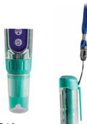
Detalles vaso de calibración