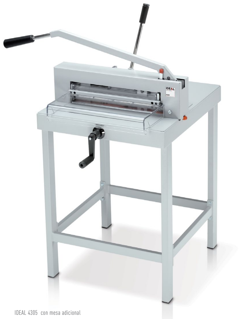
IDEAL 4305 con mesa adicional