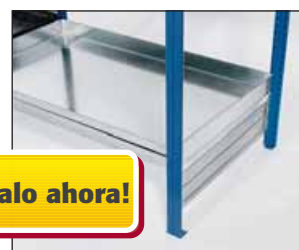
Baldas (tipo cubeta) adicionales Referencia 13057-7116