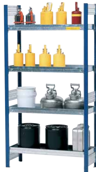
Estantería (fondo 445 mm) con 4 baldas (tipo cubeta) cincadas Referencia 2721-7116