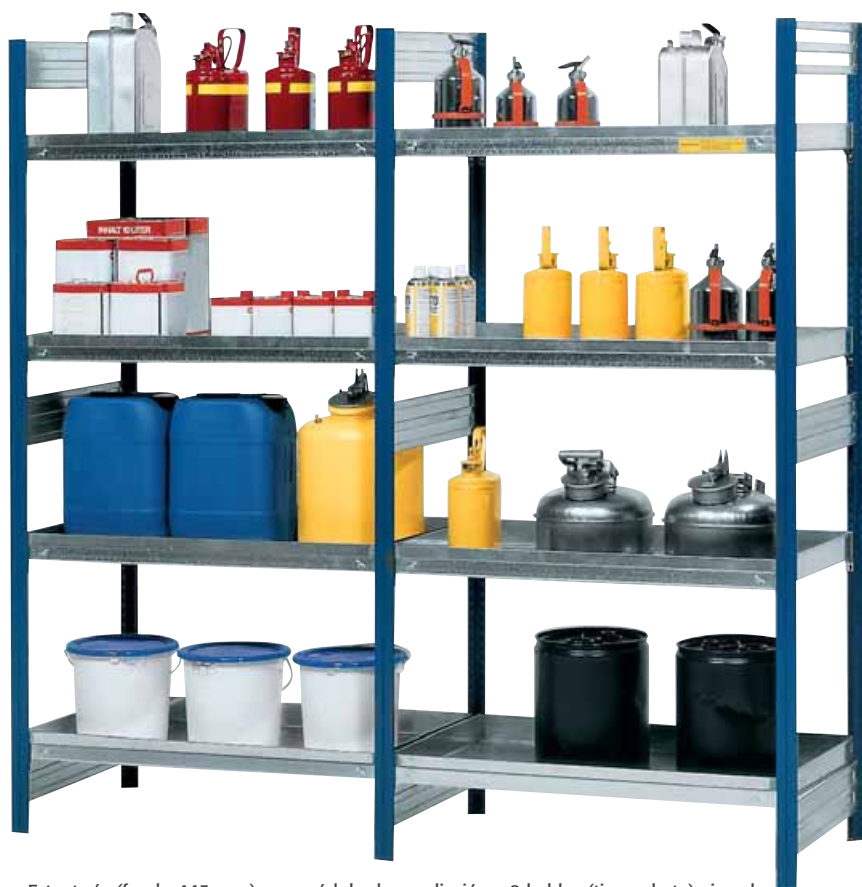
Estantería (fondo 445 mm) con módulo de ampliación y 8 baldas (tipo cubeta) cincadas