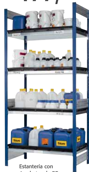
Estantería con 4 cubetas de PE Referencia 2860-7116