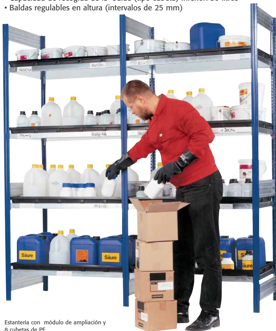
Estantería con módulo de ampliación y 8 cubetas de PE