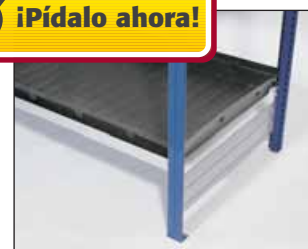
Cubetas de PE Referencia 2865-7080 90,-