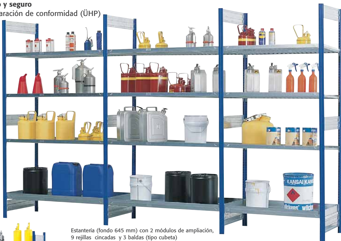
Estantería (fondo 645 mm) con 2 módulos de ampliación, 9 rejillas cincadas y 3 baldas (tipo cubeta)

Estantería 1 x Referencia 8877-7116 455,-