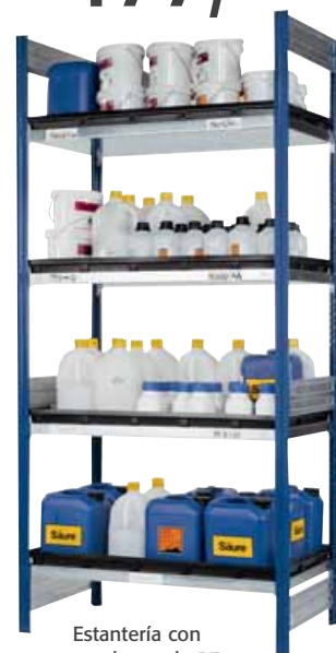
Estantería con 4 cubetas de PE Referencia 2860-7116