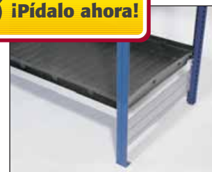
Cubetas de PE Referencia 2865-7080 90,-