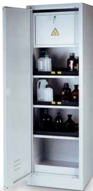
Foto: C.197.60-F Armario para productos tóxicos con 3 bandejas, cubeto de retención, 3 protectores de PE y 1 cofre interior.